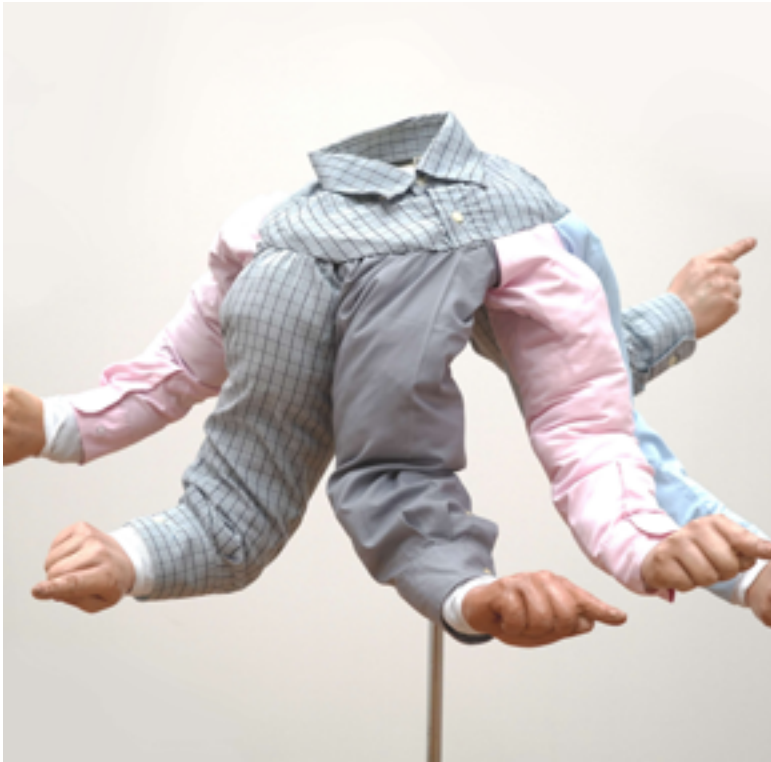
Je veux dire tout le monde taille variable 2020