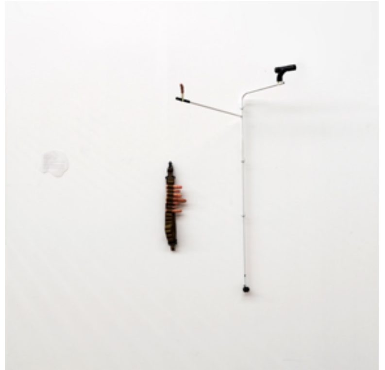
Le sceptre d'Ubu 1,40 x 1,10 cm 2020