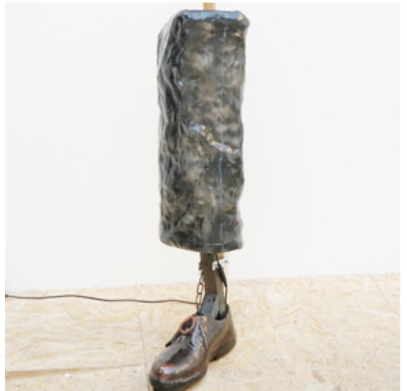
Une sorte de danse 135 x 30 cm 2022