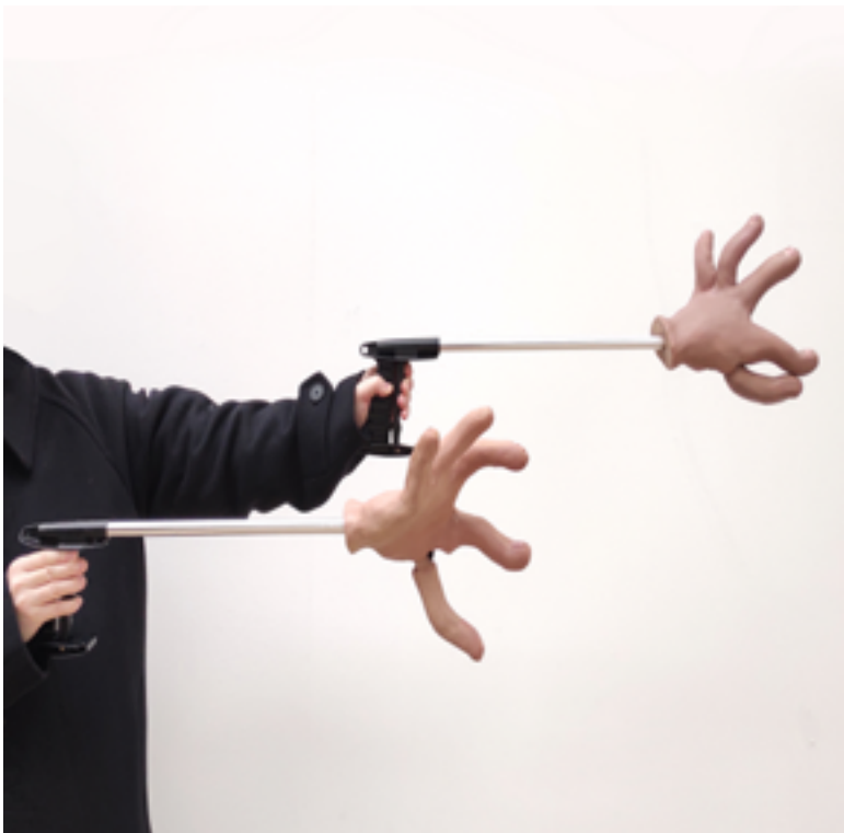
Clicker taille variable 2021