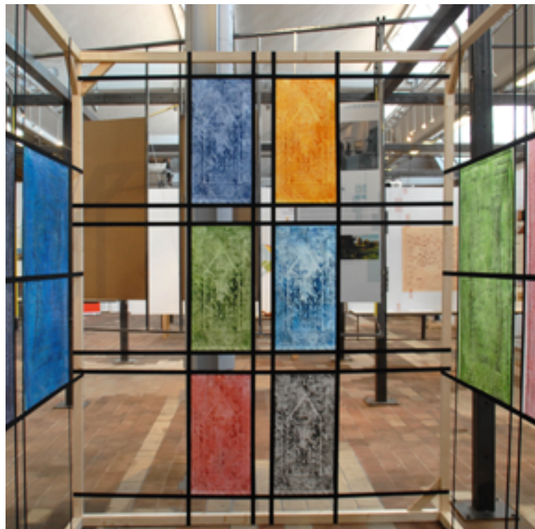
Sejada Vernis mou, colle vinylique, papier de soie, 121 x 80,5 cm, 2020