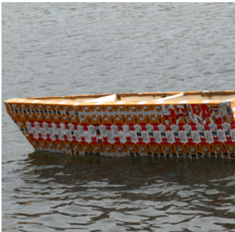
Harraga paquets de cigarettes - bois - polystyrène 4m x 2m x 0,70m 2017