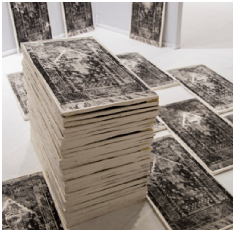
Haya al salat, haya ala falah (Levez-vous pour la prière, levez-vous pour le travail) Vernis mou - 45 tirages au plâtre - carrés de mousse - carriole dimensions variables, 2018-2019