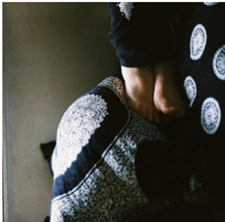
La ballade de Drifa vidéo 10'55 min